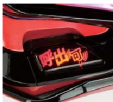
筐体背面の外部端子板